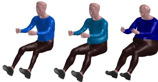
ESI's new Human Models for the Disabled, Elderly and Overweight

positionnement exact du mannequin Hybrid II et à de nouvelles fonctionnalités telles que la mise en place d'un harnais. Les ingénieurs en charge de l'aménagement intérieur et du développement des sièges peuvent ainsi effectuer en quelques clics les itérations nécessaires à la réussite de la certification des sièges.