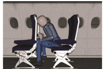
Image : Fabrication du siège (à gauche), confort thermique sur siège chauffant (milieu) et test HIC (à droite), réalisés virtuellement avec ESI Virtual Seat Solution